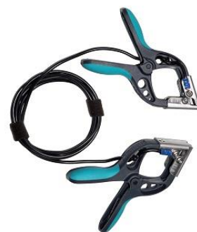
Câble de raccordement avec petites pinces TTA