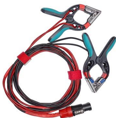
Câbles de courant et détecteurs de tension d'enroulement HT avec petites pinces TTA