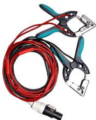
Câbles de courant et détecteurs de tension d'enroulement BT avec petites pinces TTA