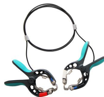
Câble de raccordement avec pinces TTA