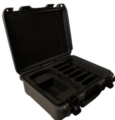
Coffre de transport en plastique pour TWR-H, TRT-H et RMO-TH