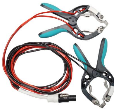
Câbles de courant et détecteurs de tension d'enroulement BT avec pinces TTA