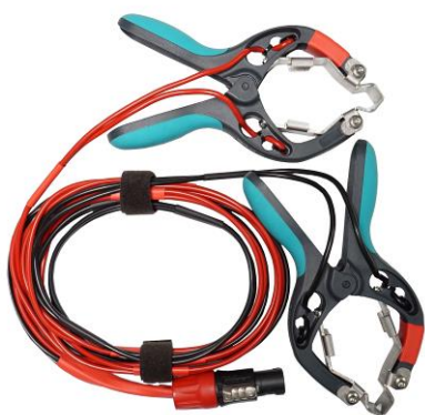
Câbles de courant et détecteurs de tension d'enroulement HT avec pinces TTA

Toutes les présentes spécifications sont valables à des températures ambiantes de +25 °C, et avec les accessoires recommandés. Les spécifications sont sujettes à modification sans préavis.